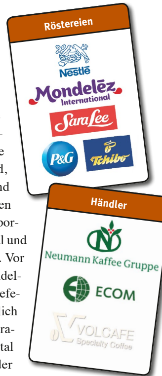
Hauptakteure in der Kaffeeindustrie