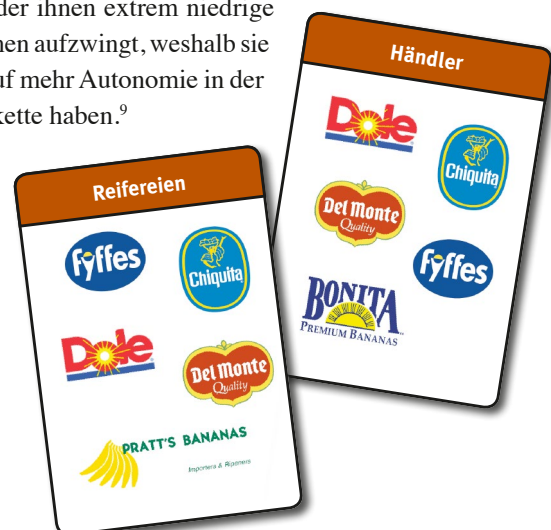
Hauptakteure im Geschäft mit Bananen

Bananen sind das zweitwichtigste Exportgut der dominikanischen Republik und eine wichtige Beschäftigungs-, Gehalts- und Einkommensquelle in ärmeren Regionen des Landes. 6 90 Prozent der Produzenten sind Kleinbäuerinnen und Kleinbauern (mit einer Anbaufläche von 1,2 bis 2,5 ha), sie erwirtschaften ca. 50 Prozent der Bananenproduktion des Landes. 7 Aufgrund der fehlenden Infrastruktur (Lagerung, Kühlung, Exportlogistik) für die empfindlichen und leicht verderblichen Bananen haben Kleinbauern nicht die Möglichkeit, selbst zu exportieren. Deshalb landen Kleinbauern für den Export ihrer Früchte bei privaten Exporteuren, die üblicherweise vertikal integriert arbeiten. Oftmals besitzen die Exporteure große Bananenplantagen, deren Erträge sie zuerst an ihre Kunden verkaufen. Kleinbauernkooperativen fungieren nur als Lieferanten von Pufferbeständen, egal wie hoch die Qualität oder wie wettbewerbsfähig ihr Angebot ist. 8 Ohne direkten Zugang zu Importeuren oder Marktinformationen bleiben Kleinbauernkooperativen oft in Abhängigkeit vom Exporteur, der ihnen extrem niedrige Handelskonditionen aufzwingt, weshalb sie kaum Aussicht auf mehr Autonomie in der Wertschöpfungskette haben. 9