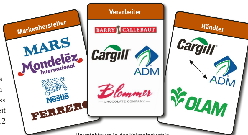
Hauptakteure in der Kakaoindustrie

Abgesehen von einigen Schweizer Konzernen stammen die mächtigsten Einzelhandels- und Nahrungsmittelkonzerne, die Hersteller von Agrarbetriebmitteln und Handelskonzerne aus den G7-Ländern. Um die Verletzungen von Arbeitsrechten von Plantagenarbeiter/innen und unfaire Handelspraktiken gegenüber Kleinbäuerinnen in globalen Produktketten zu verhindern, müssen die „Lead Companies“, also die mächtigen Konzerne in den Ketten, zu fairen Praktiken gegenüber ihren Zulieferern und zu Transparenz und Sorgfalt entlang der gesamten Zulieferkette verpflichtet werden. Hier sind die G7-Regierungen kollektiv gefragt. Auf der Agenda der G7 steht für 2015 das Thema „soziale Standards in Lieferketten“ – höchste Zeit sich gemeinsam auf konkrete Schritte auch für den Agrarsektor festzulegen.